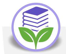
CeDA Centro di Documentazione sull'Ambiente