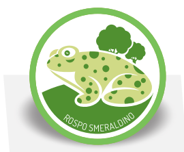
CEAS Centro di Educazione Ambientale e alla Sostenibilità