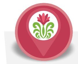
Itinerario Culturale sul Liberty